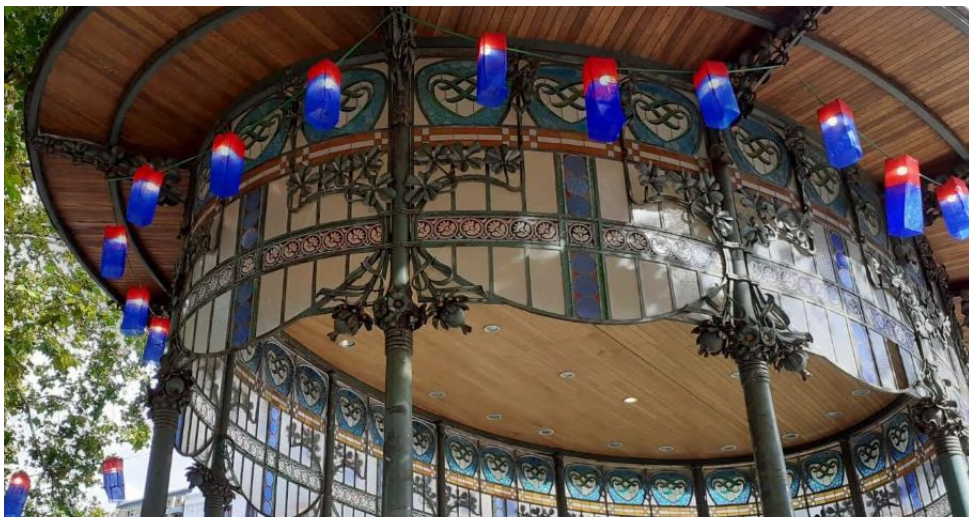
Lamparillas coreanas cheong sa cho rang con las que se ornamentará el Agüere Cultural para la Noche Amamos Corea / We ♥ Korea .

Gracias especiales a quienes más directamente nos han ayudado a ofrecer esta Noche