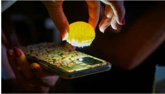
Luna crujiente rellena de queso de cabra y berenjena asada en brasa. Alérgenos: gluten y lactosa.

Sol de maíz y papas, tortilla de maíz, con parmentier de papa negra, crujiente de papa negra, gel de guayaba picante y cochino negro a baja temperatura. Sin alérgeno.