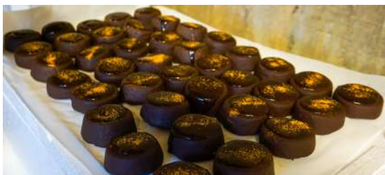
Constelación estelar, semifriobde de chocolate con frambuesa, con doble textura de cacao, crujiente y ligera con brillo, polvo de oro y crumble de plátano. Alérgenos: gluten y lactosa.

Sol de maíz y papas, tortilla de maíz, con parmentier de papa negra, crujiente de papa negra, gel de guayaba picante y cochino negro a baja temperatura. Sin alérgeno.