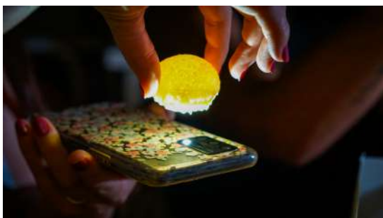
Luna crujiente rellena de queso de cabra y berenjena asada en brasa. Alérgenos: gluten y lactosa.

Sol de maíz y papas, tortilla de maíz, con parmentier de papa negra, crujiente de papa negra, gel de guayaba picante y cochino negro a baja temperatura. Sin alérgeno.