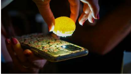
Luna crujiente rellena de queso de cabra y berenjena asada en brasa. Alérgenos: gluten y lactosa.